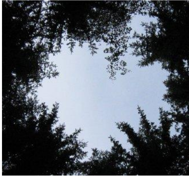
Ett fönster mot Ljuset